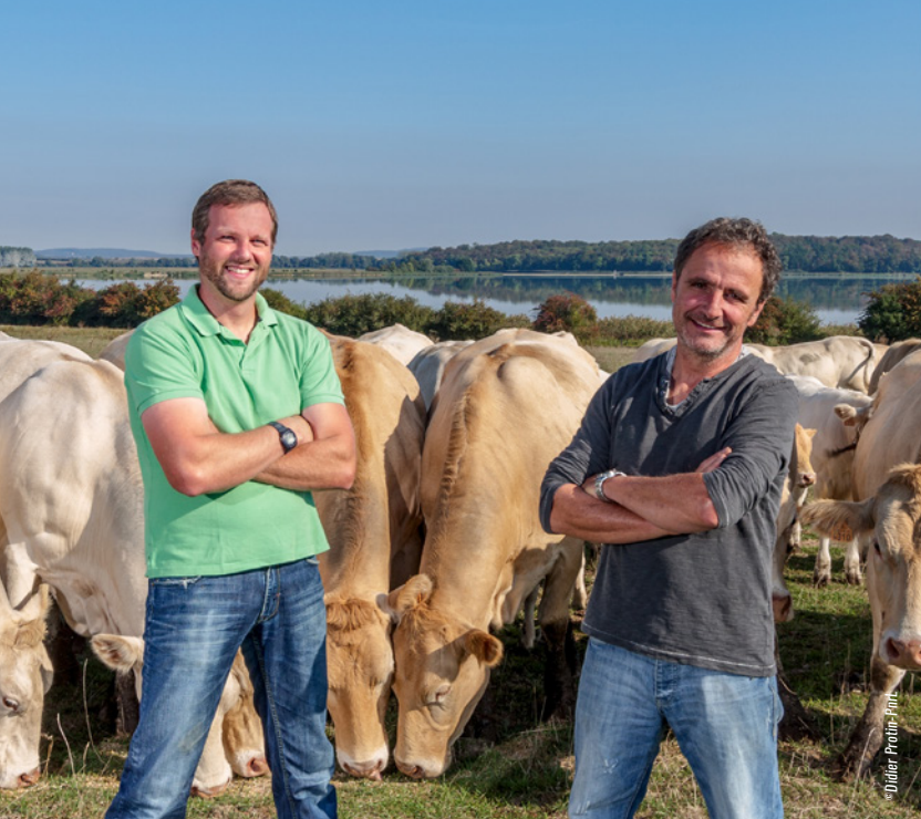
> Éleveurs membres du réseau "Valeurs Parc naturel régional de Lorraine"