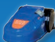
Buttler Gold Pro • Pousse-fourrage