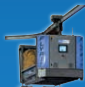
FlyPit • Robot de litière