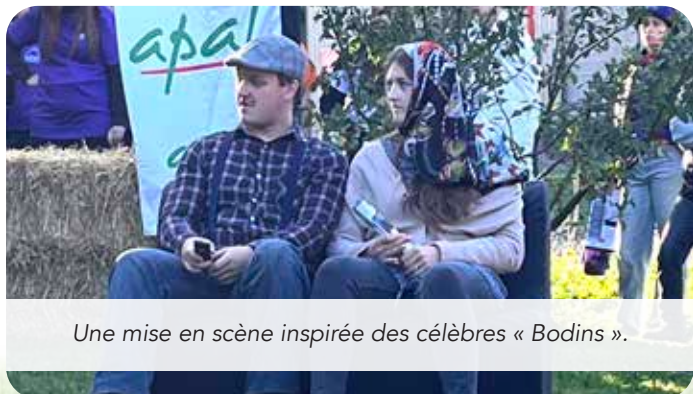
Une mise en scène inspirée des célèbres « Bodins ».

Pour stimuler la curiosité des jeunes et leur faire découvrir nos différentes missions, le premier exercice de la journée est de présenter de façon originale notre association.