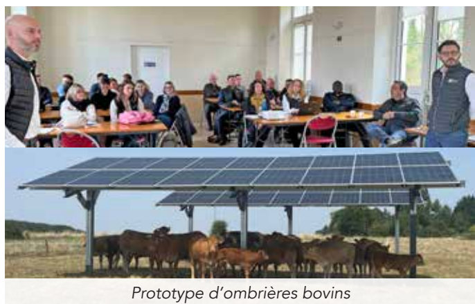
Prototype d'ombrières bovins