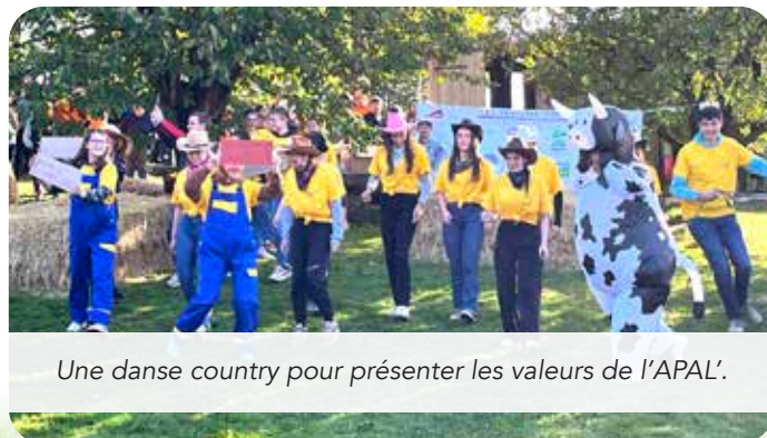
Une danse country pour présenter les valeurs de l'APAL'.