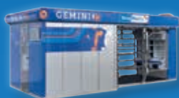
Gemini Up • Robot de traite