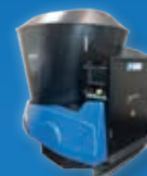
Shuttle Eco • Robot d'alimentation