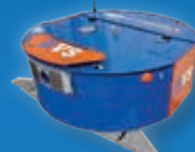
BVS • Aspirateur de lisier automatisé